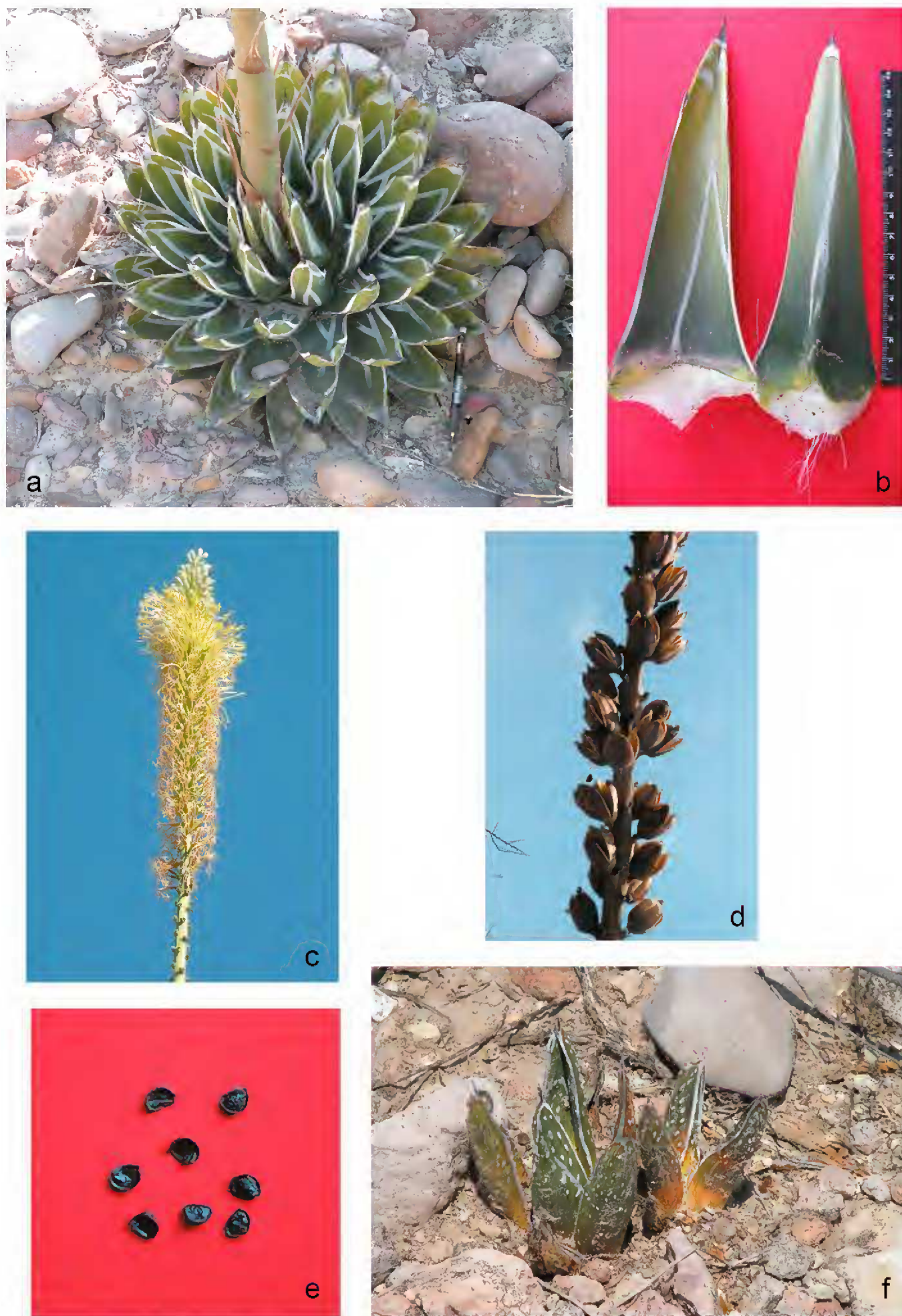
Fig. 4. Agave pintilla : a. roseta con base de escapo y brácteas; b. hojas, vista ventral y dorsal; c. inflorescencia; d. infrutescencia; e. semillas; f. plántula.